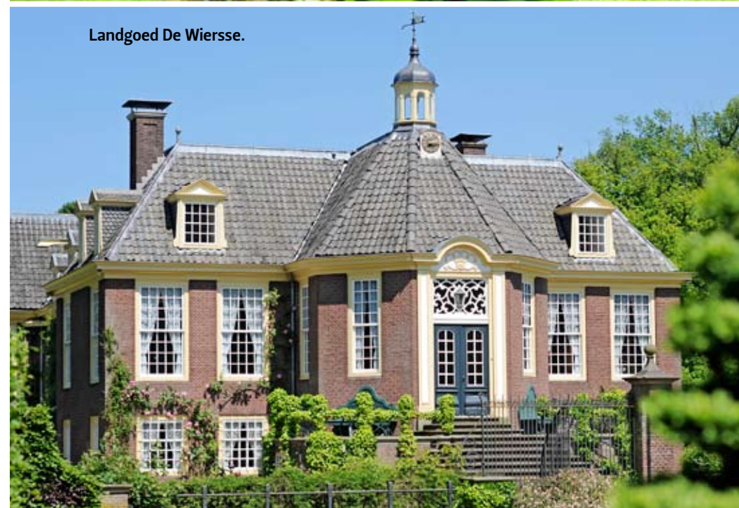
Landgoed De Wiersse.