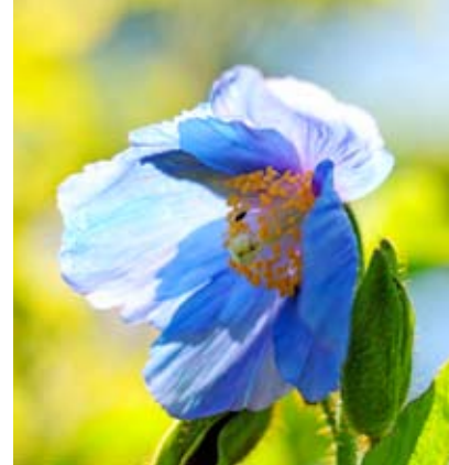
Blauwe papaver ( Meconopsis betonicifolia ).