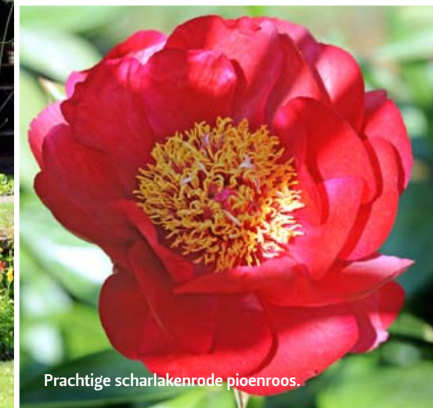
Prachtige scharlakenrode pioenroos.