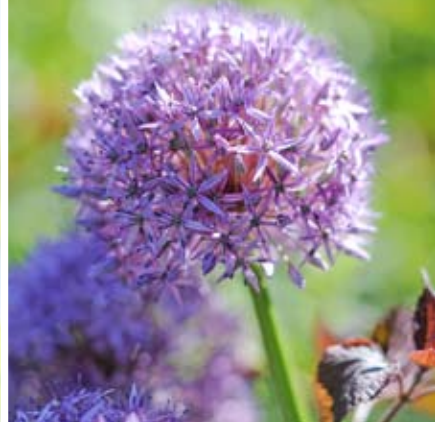
Sierui ( Allium ).