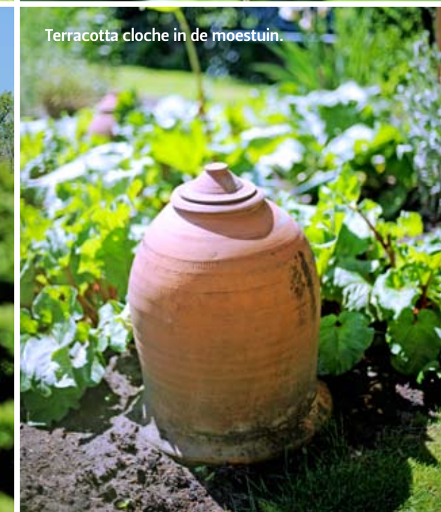
Terracotta cloche in de moestuin.