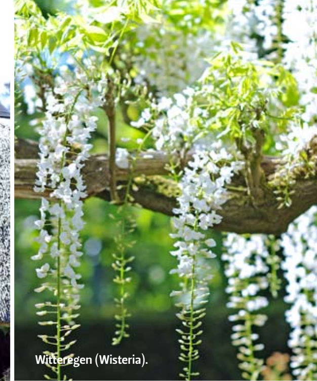
Witterregen ( Wisteria ).