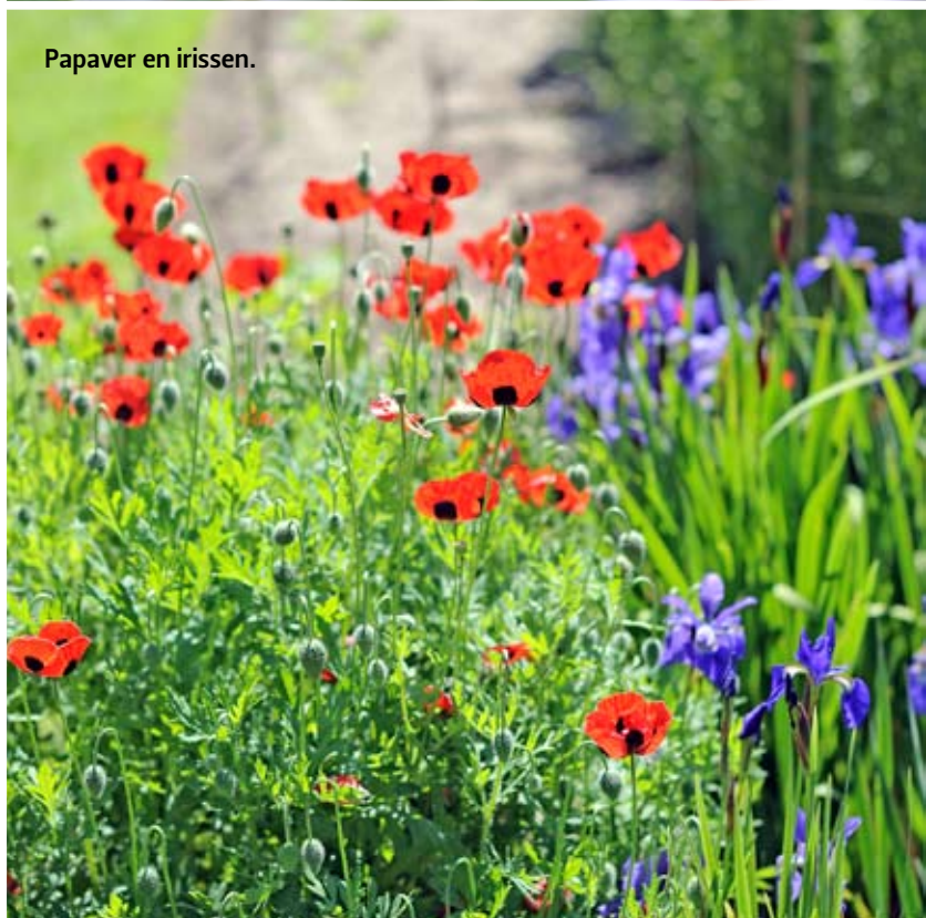
Papaver en irissen.